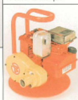
Motor gasolina Briggs Motor Briggs gasoline Moteur essence Briggs