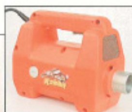
Motor eléctrico Electrical motor Moteur électrique

REGLAS VIBRANTES • VIBRADORES ALTA FRECUENCIA • VIBRADORES CONVENCIONALES VIBRATING RULERS • HIGH FREQUENCY VIBRATORS • CONVENTIONAL VIBRATORS REGLES VIBRANTES • VIBRATEURS A HAUTE FREQUENCE • VIBRATEURS CONVENTIONNELS